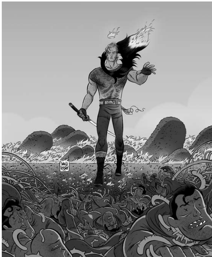
Ilustración de David Rubín para 'El héroe – Libro uno'

elementos, segundo José , son a «voz» do autor, e cómpre que esta sexa «tan persoal coma a propia voz real para que se converta nunha forma de expresión e comunicación que conecte co lector». David Rubín , pola súa parte, estima que a clave está na fórmula «persistencia, fuxir da autocompracencia, apertura de miras, autocrítica, risco e talento». Jacobo Fernández cre, en cambio, que non hai tales factores: «podemos pensar en condicións laborais, en educación artística, en cultura comiqueira e literaria, en liberdade creativa, no apoio dunha industria, en distribuidoras transparentes, na existencia de lectores, e en mil cousas máis; pero ningunha delas che asegura a